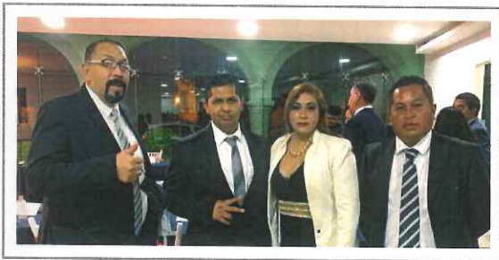
• TESORERÍA MUNICIPAL •

Es un honor presentar mi primer informe de actividades, todo encaminado al beneficio Del municipio, gestiones, aportaciones, compromisos generados en campaña, la Solución de las problemáticas que me presento la ciudadanía, todo esto lo asumo Como mi principal responsabilidad , cumpliendo con el mandato de la ley orgánica Municipal que nos indica cuidar los intereses del pueblo, con la misma responsabilidad Tengo las comisiones a mi cargo de: