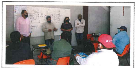
• INSTITUTO DE CAPACITACIÓN •