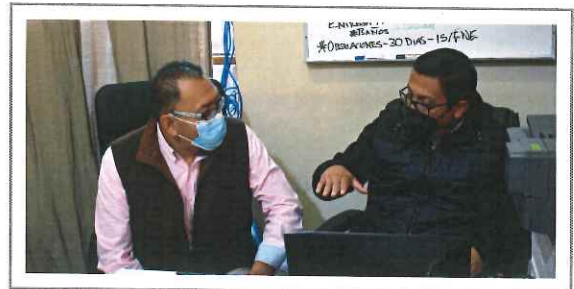
• OBRAS PÚBLICAS •